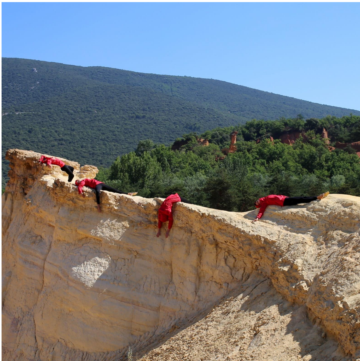
Photo Workshop 2019 - Etude d'une installation chorégraphique in situ

Site Le Laboratoire d'Art Contemporain : www.lelac.co