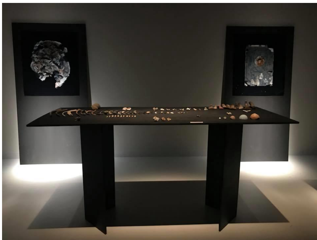
Exposition à Tokyo - National Photos Museum of Emerging Science and Innovation, Miraikan Juillet 2018 – Photos et objets classés sur table provenant du travail intitulé Tamesiology